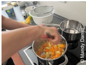
Beikost-Workshop Teeküche EG