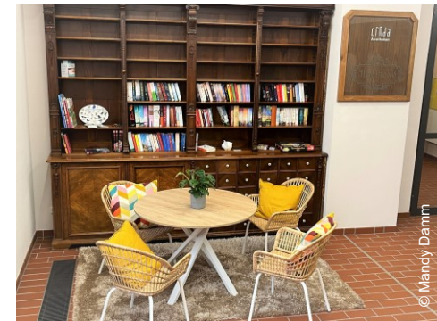
Eingang / Lese- & Spielecke