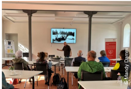
Lesung „Hier ist herrlich arbeiten“