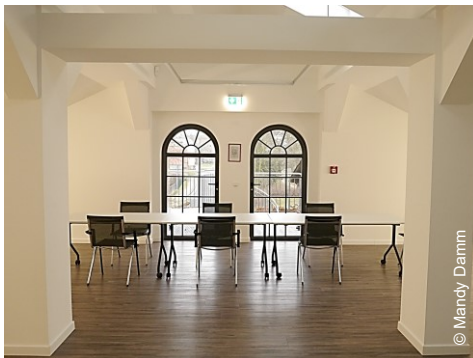
Kleiner Veranstaltungsraum OG