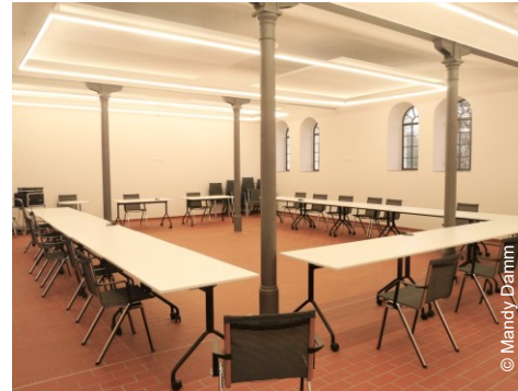
Großer Veranstaltungsraum EG